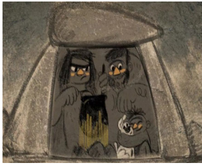
La Grotte La Maison