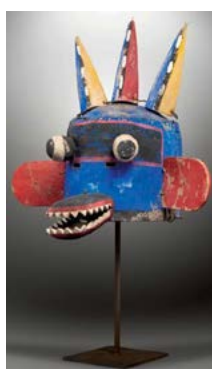
Enfant sauvage au Nouveau Mexique

..... Un album pour introduire le rôle des masques et en inventé dans la classe :