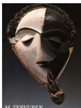
M. TERVUREN Masque MBANGU, l'ensorcelé, représentative de l'art Pende, elle est conservée au Musée de Tervuren.

Des représentations de masques de continents différents... pour des idées plastiques.